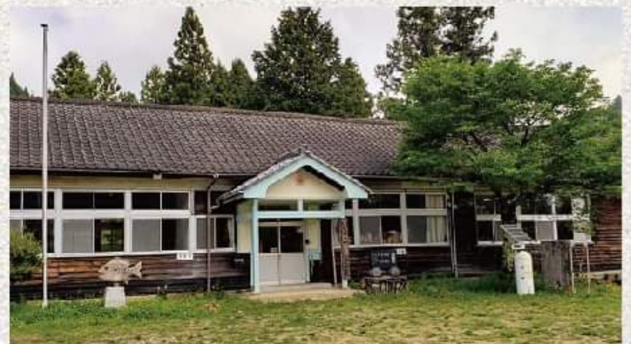
旧田人第二小学校南大平分校グラウンド 〒974-0152 いわき市田人町南大平字 坪内 95-1